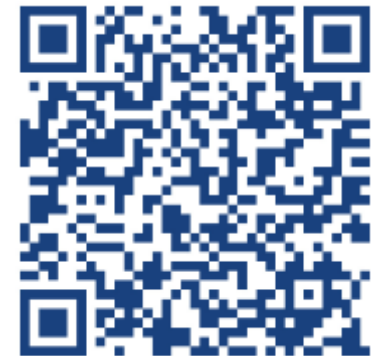
Galerie photos du club

Le club photo est une activité du Centre Culturel d'Achères CCA